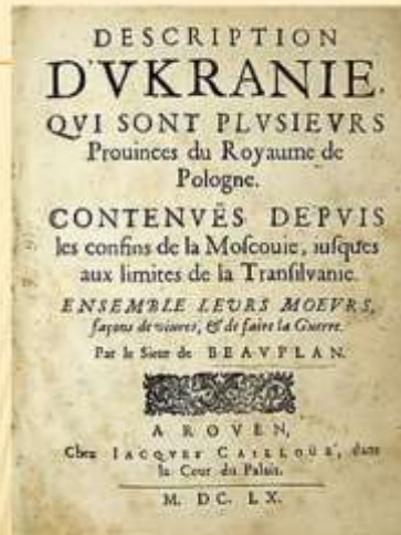
Титульна сторінка «Опису України...»