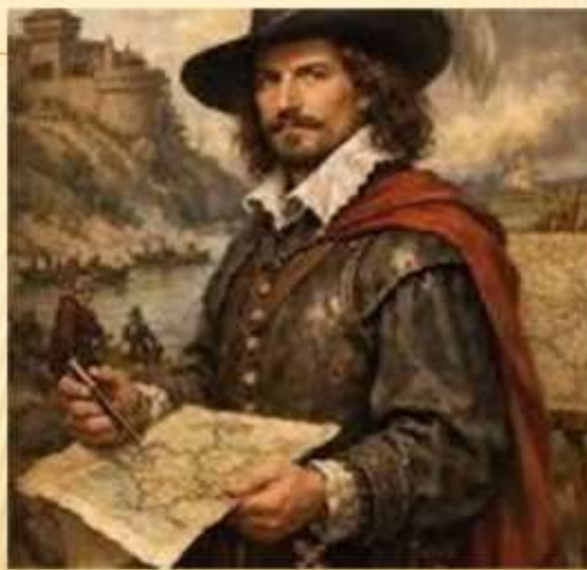
Гійом Ле Вассер де Боплан (імовірно 1600 – 1675)