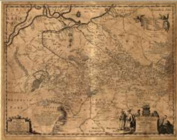
Генеральна карта України Г. Ле Вассера де Боплана