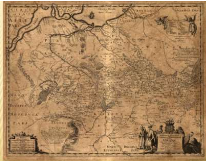
Генеральна карта України Г. Ле Вассера де Боплана