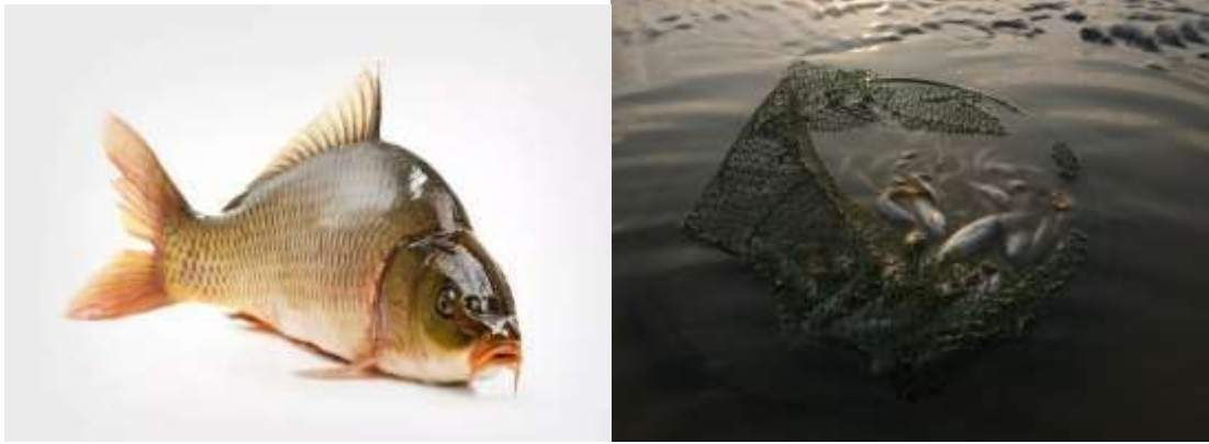
Рис.1. Вирощування коропа

Існують також труднощі з утриманням коропа: риба починає хворіти, якщо в резервуарі його забагато; початкові інвестиції грошей будуть виправдані лише через 1-2 роки, коли мальки дозріють і наберуть певну масу.