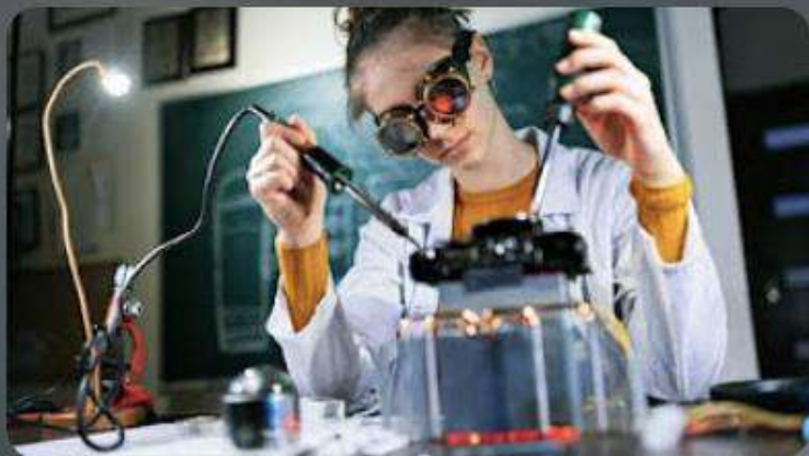
Конкурс винахідницьких і раціоналізаторських проектів...

Всеукраїнський конкурс винахідницьких і раціоналізаторських проектів еколого-натуралістичного напрямку (вікова категорія 16-23 років включно) у 2024 році (дистанційний формат). Наказ № 20 від 01.03.2024. URL: https://nenc.gov.ua/wp-content/uploads/2024/02/03-01-20.pdf