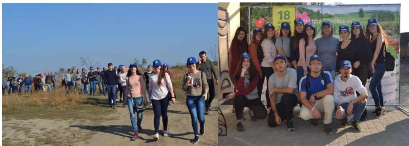
СОК «Горіх Причорномор'я» (с. Троїцьке, Біляївський район, Одеська область)