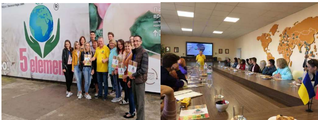
ТОВ «НПП «5 element» (м. Херсон, Херсонська область)