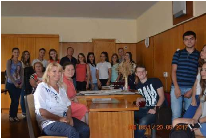
СТОВ «Агрофірма» Петродолинська» (с. Петродолинське, Овідіопольський район, Одеська область)

За 2017-2020 р. було відвідано понад 15 підприємств різної форми власності та виду діяльності (ПрАТ «Одесавинпром» та «Югторгсервис» (м. Одеса), ТОВ «НПП «5 element» (Херсонська обл.), СОК «Горіх Причорномор'я», ТОВ «Промислово-торговельна компанія Шабо», ФГ «Пан Білан», ТОВ «Агрофірма Евріка», ТОВ «Ірригатор», ННЦ «ІВіВ ім. В.С. Таїрова», ФГ «Вареник», СТОВ «Факел», ПАТ «Мирний», СТОВ «Роздільнянське», ПАТ «Южний», СТОВ «Агрофірма» Петродолинська» (Одеська обл.).