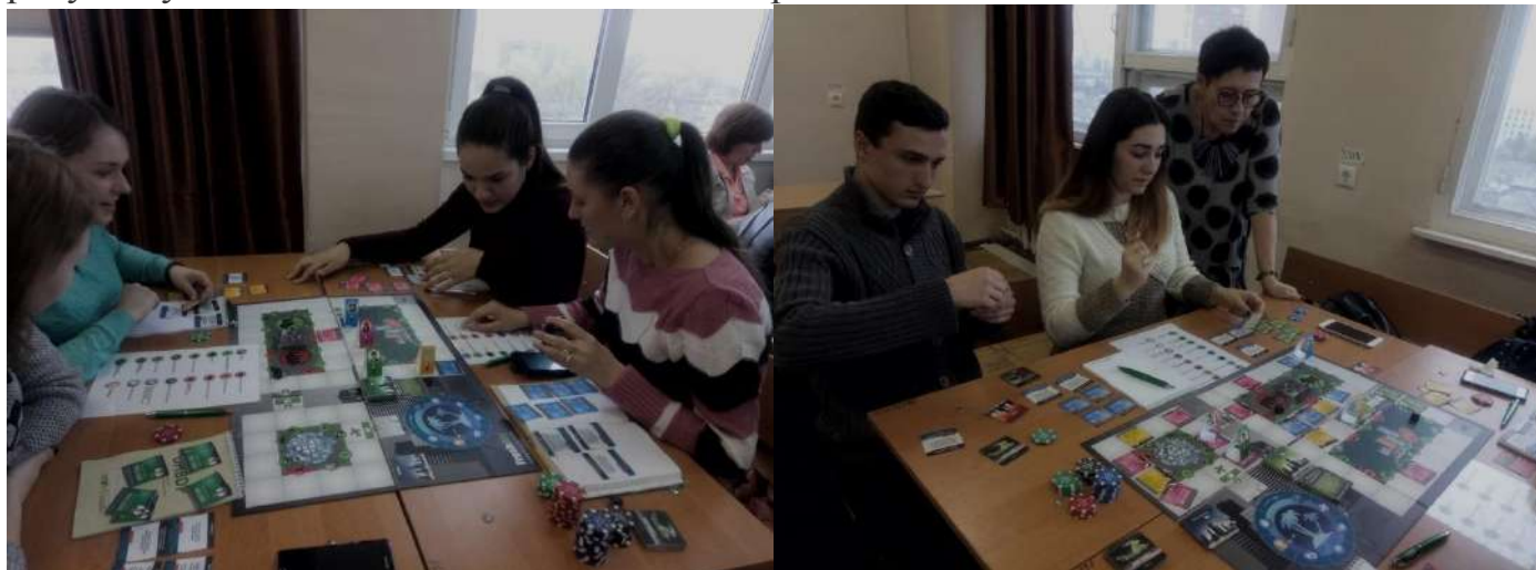
Студенти під час бізнес-гри FreshBiz