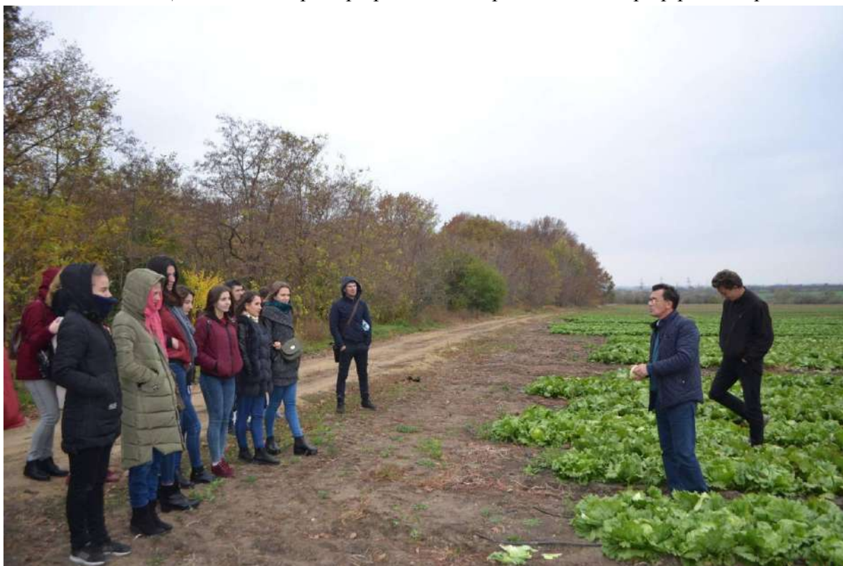
В фермерському господарстві «Пан Білан»