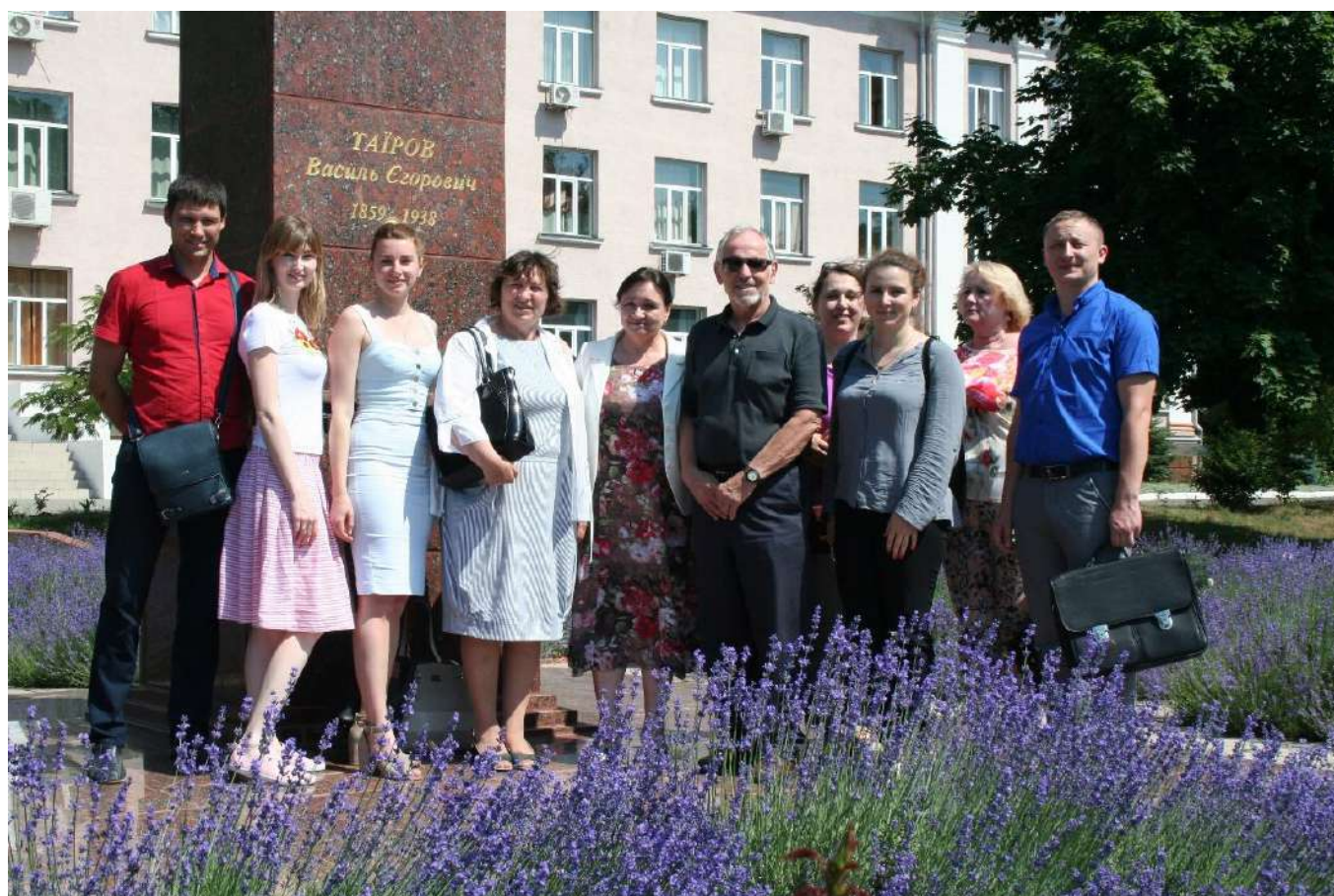
Під час відвідування ННЦ «Інститут виноградарства і виноробства ім. В.Є. Таїрова»