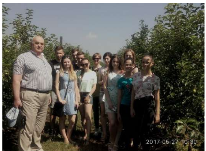
ПАТ «Мирний» (с. Мирне, Біляївський район, Одеська область)