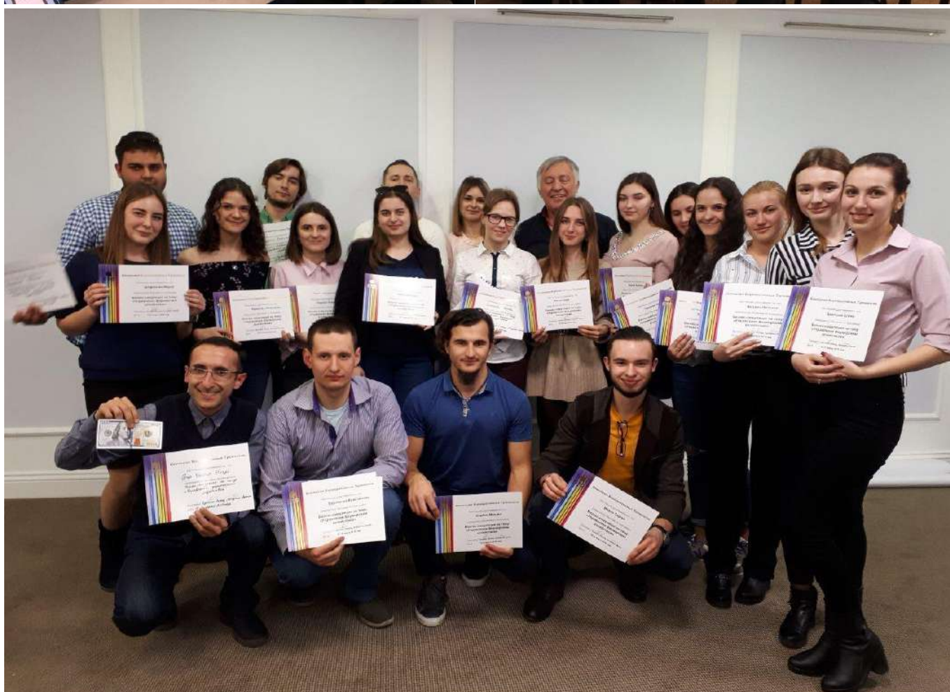
Учасники бізнес-симуляції «Управління фермерським господарством»