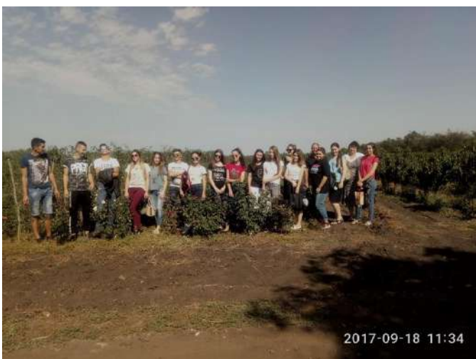
СТОВ «Роздільнянське» (м. Роздільна, Одеська область)