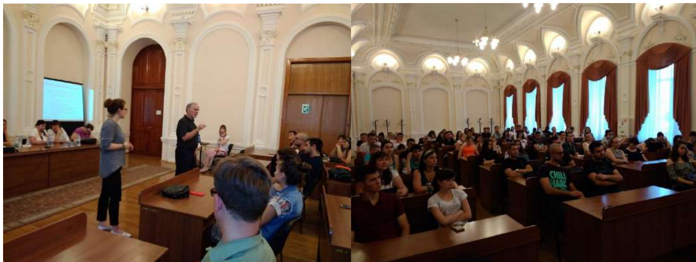
Лекція професора Стенлі Томпсона

В рамках програми обміну викладачами (англ. Faculty Exchange Program (FEP)), що здійснювалася за підтримки Міністерства сільського господарства США (англ. The United States Department of Agriculture (USDA)), економічний факультет Одеського державного аграрного університету відвідав професор Університету штату Огайо Стенлі Томпсон , який провів лекцію для студентів економічного факультету.