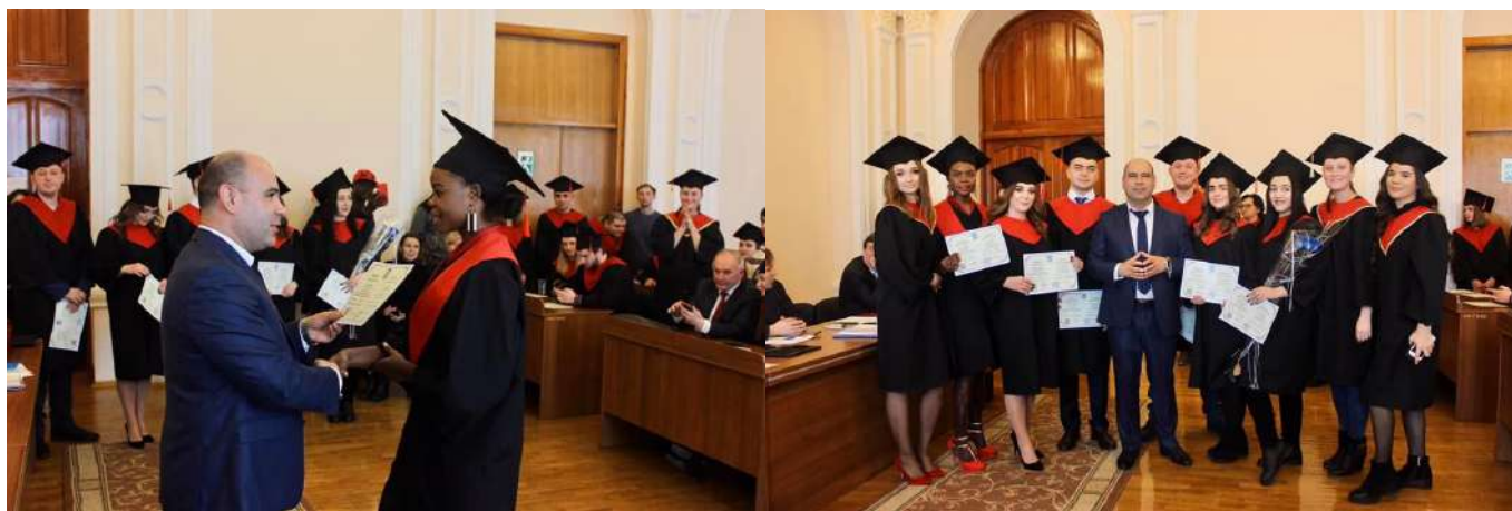
Випуск магістрів 2019 р., Оахо Охакі Берті

Кафедрою менеджменту здійснюється підготовка іноземних студентів на бакалаврському та магістерському рівнях. Під час свого навчання іноземні студенти є повноправними учасниками суспільного, наукового, спортивного і культурного життя університету. Разом із українськими студентами вони беруть активну участь у заходах, що постійно проводяться кафедрою, університетом, цілеспрямовано займаються науково-дослідною роботою і є постійними учасниками міжнародних науково-практичних конференцій.