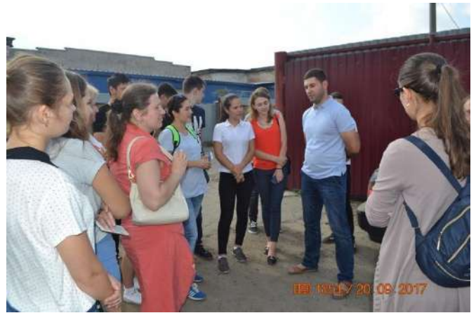
Овочево-торговельна база «Югторгсервис» (м. Одеса)