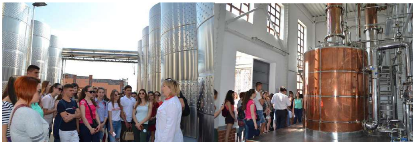
ТОВ «Промислово-торговельна компанія Шабо» (с. Шабо, Білгород-Дністровський район, Одеська область)