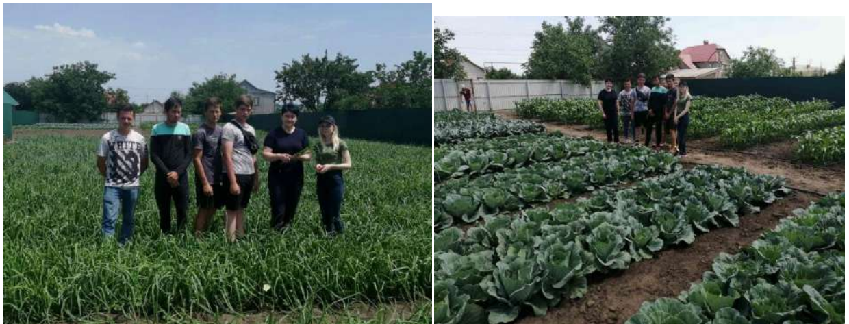
Рис.5 Вивчення технології вирощування овочевих культур у відкритому ґрунті, компанія «Ісіда-2012»