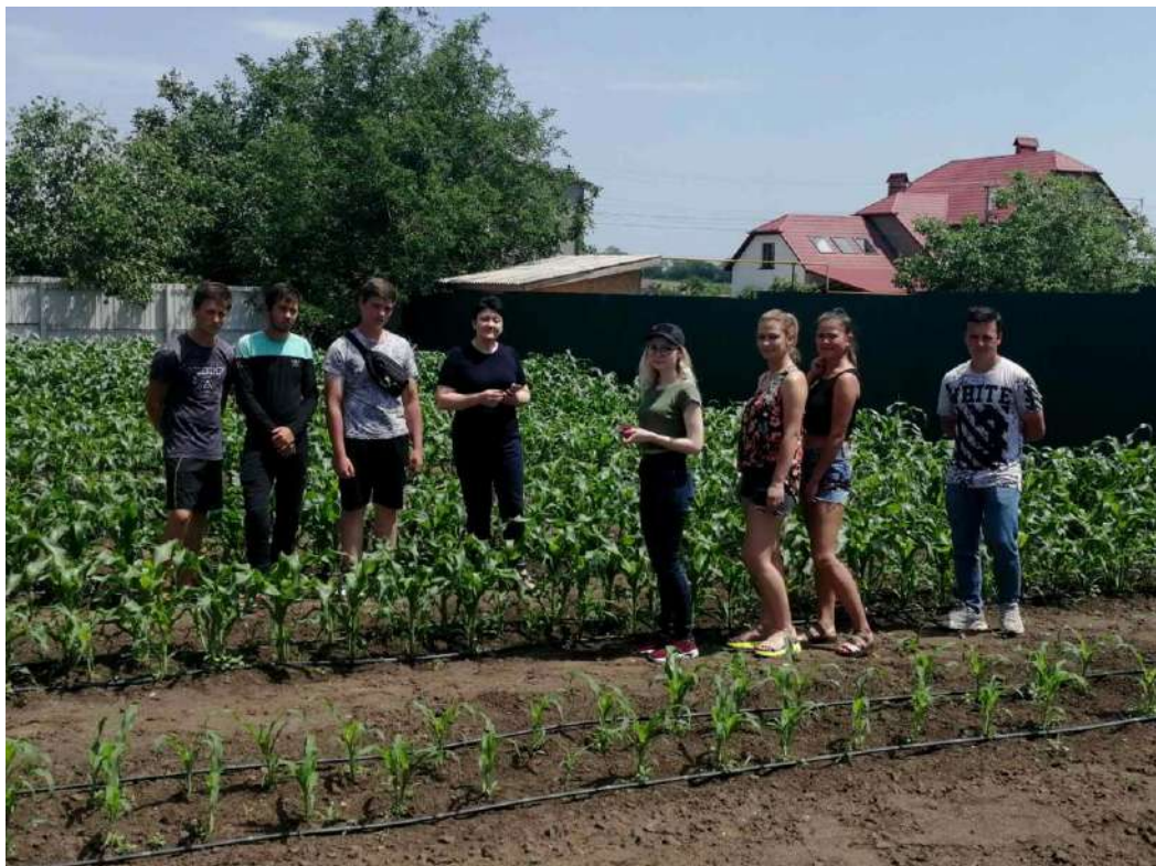
Рис.6 Визначення фаз розвитку рослин кукурудзи цукрової за різних строків сівби, компанія «Ісіда – 2012»

Протягом навчального року члени гуртка систематично відвідували ФГ «Пан Білан» де проводили наукову роботу, проходили навчальну практику та вивчали особливості вирощування розсади овочевих рослин, зеленних