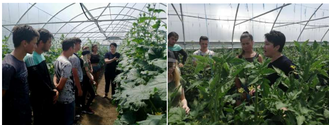
Рис.4 Знайомство членів гуртка з особливостями нових гібридів овочевих культур, компанія «Ісіда-2012»