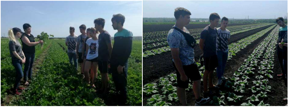
Рис. 9 Вивчення особливостей технології вирощування малопоширених овочевих культур, ФГ «Пан Білан»