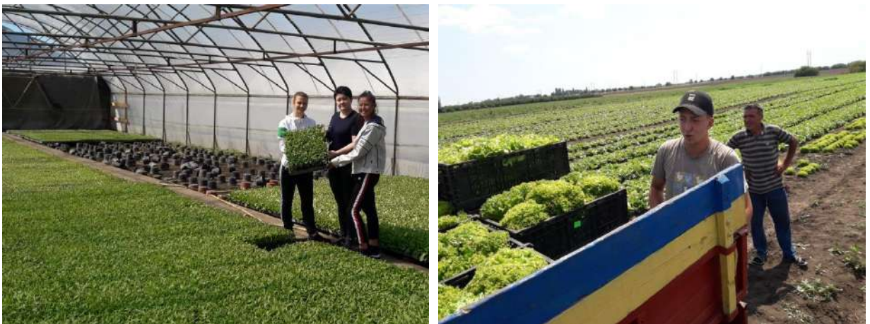
Рис. 11 Члени гуртка приймають участь у вирощуванні салату у відкритому ґрунті, ФГ «Пан Білан»