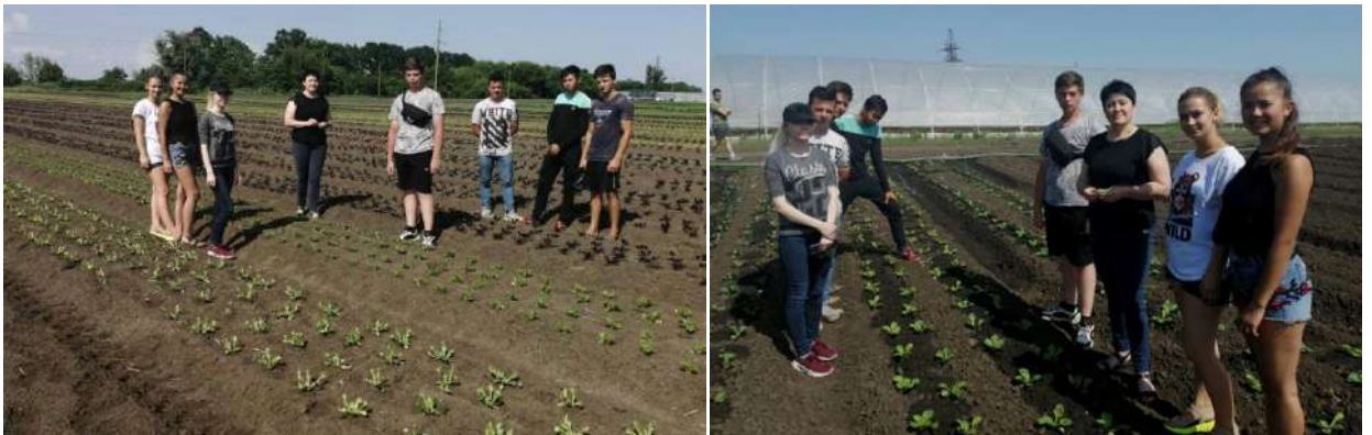
Рис. 10 Члени гуртка «Овочівник» опановують технологію вирощування овочевих культур розсадним способом, ФГ «Пан Білан»