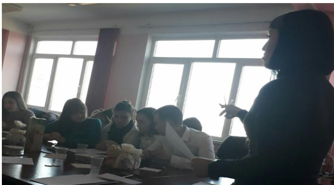
Проведення ділової гри на тему «Аукціон технологій»