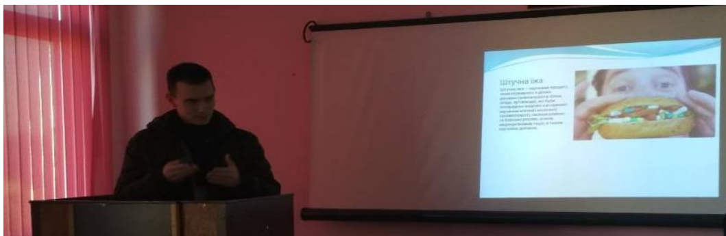
Організація та проведення конкурсу на кращу презентацію «Сучасні технології виробництва, зберігання та переробки продукції тваринництва»