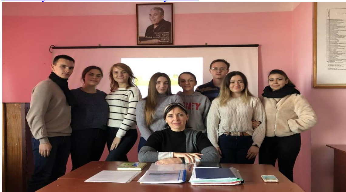
Організація та проведення конкурсу на кращу презентацію «Сучасні технології виробництва, зберігання та переробки продукції рослинництва»