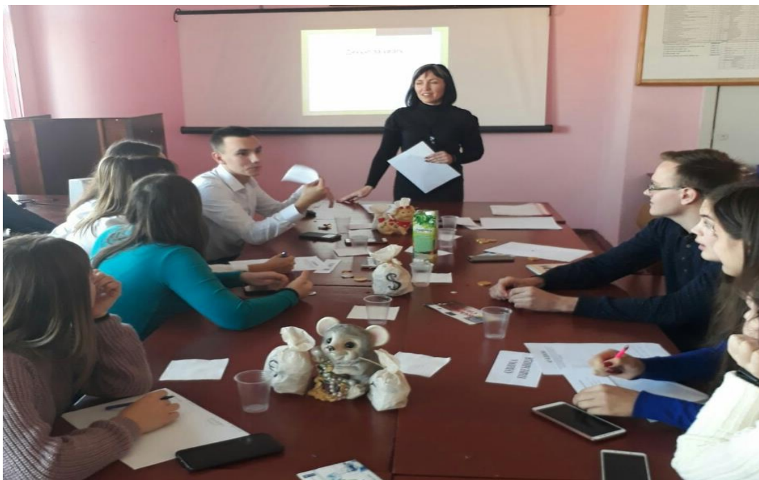
Проведення ділової гри на тему «Аукціон технологій»